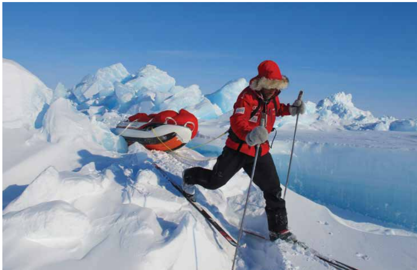
Во время экспедиции на Северном Полюсе

задохнешься, и при этом тебе нужно подниматься вверх без остановки с тяжелым рюкзаком. На этой высоте можно находиться лишь очень ограниченное количество времени, поэтому ты не можешь остановиться и передохнуть, а ты устал, очень устал. К этому надо добавить, что в случае чего спасти тебя некому, волшебный вертолет не прилетит и мама далеко! И даже когда ты на вершине, ты прошел только половину пути, причем самую легкую. Спуститься с Эвереста гораздо сложнее, чем подняться на него, — большинство погибших в этих местах погибли именно на спуске. На горе лежат две с половиной сотни трупов. Ты проходишь мимо них, и это по-настоящему страшно.