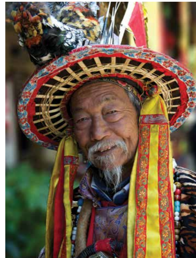
Представитель народности наси, населяющей предгорья Гималаев

В стародавние времена жила в Поднебесной божественная Нюйва. Забот у нее особо не было, и вот, однажды, забавы ради она стала лепить из желтой глины фигурку человечка, взяв за образец свое отражение, увиденное в зеркальной глади пруда. Ей так понравилось это занятие, что богиня налепила великое множество человечков — мужчин и женщин. Ожившие творения радостно плясали вокруг своей создательницы. Некоторых из них Нюйва слепила собственноручно, а некоторые появились из кусочков глины, которую она просто разбрызгала по земле. Так Поднебесную заселил народ, поражающий своим количеством с глубокой древности. Имя этому народу — китайцы.