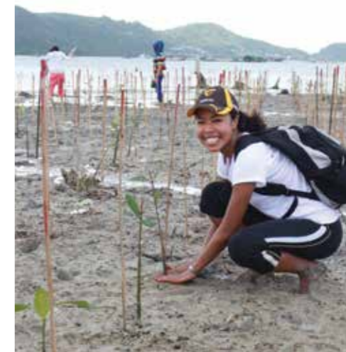
Высадка мангровых деревьев на о. Пхукет, Таиланд