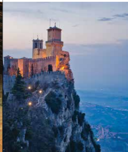
Замок в республике Сан-Марино

Зима — период шопинга, особенно в канун рождественских скидок и распродаж. В это время сюда съезжаются рьяные шопоголики со всего мира, самозабвенно опустошая полки с вещами премиум-класса.