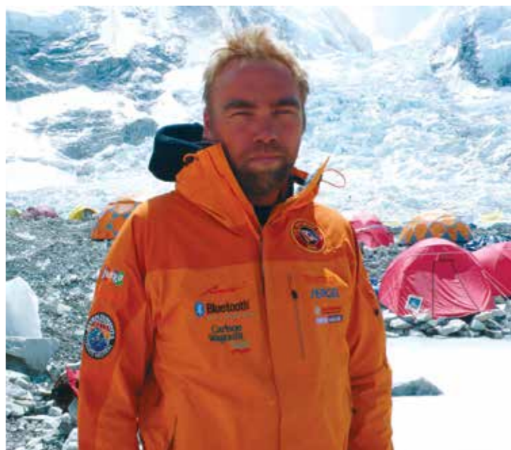
Во время восхождения на Эверест

Нильсон успел объездить 146 стран и побывать в сорока экспедициях. Самая впечатляющая из них — поход от Северного полюса к Южному с использованием экологических видов транспорта, в начале которого он чуть не погиб, а к финишу пришел с двумя сломанными ребрами и записью в Книге рекордов Гиннесса. Сегодня Йохан Эрнст — один из известнейших в мире лекторов, которого приглашают как в Кремль, так и в Белый дом. Мы поговорим с ним о том, на что способен человек, когда он движется к своей цели, о простых истинах и детских потрясениях, сформировавших характер героя.