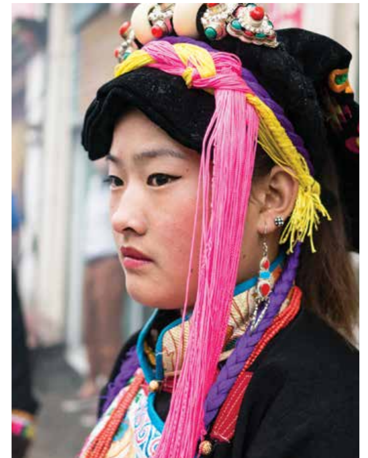
Девушка в национальном тибетском костюме