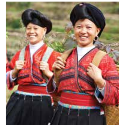
Представительницы национального меньшинства яо в традиционных костюмах

Старинная китайская поговорка гласит: «На десять ли* не найдется двух одинаковых обычаев». Убедиться в этом просто — достаточно посетить небольшой, но очень колоритный остров Хайнань, с его деревушками и национальными этнографическими парками. //