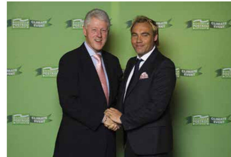
С Биллом Клинтонем

— Я очень осторожен в выборе ролевых моделей, но не могу устоять перед людьми, которые готовы пожертвовать собственной безопасностью ради помощи другим. Перед теми, кто без всякой личной выгоды делает мир лучше. Через месяц я встречаюсь с Далай-ламой, который для меня является фигурой, наиболее приближенной к ролевой модели. В свое время меня поразила в нем одна вещь. Как-то Далай-лама приехал в Норвегию с визитом, но правительство так боялось гнева Китая, что ни одно официальное лицо не стало с ним встречаться. Кто-то спросил у Далай-ламы, как он себя чувствует в роли отверженного в Норвегии, и тот ответил, что страна состоит из народа, а не из правительства,