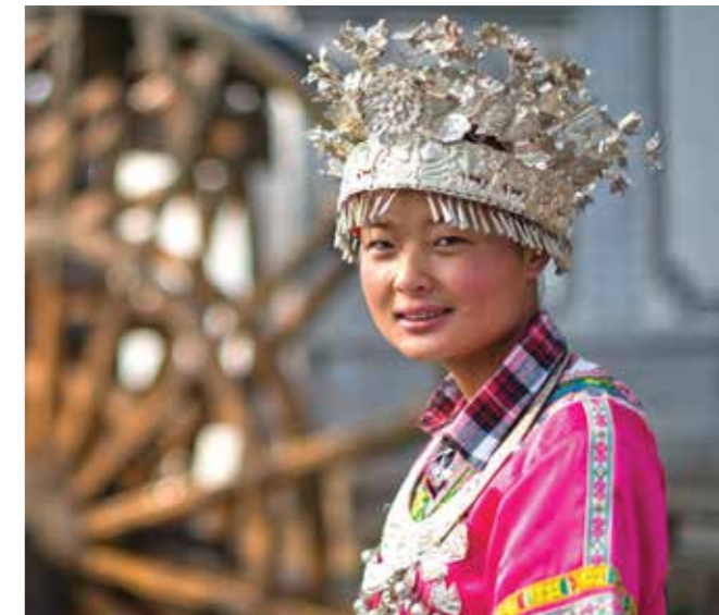
Серебряные аксессуары женщин мяо

Среди этнических групп Китая самая большая — чжуан, а самая маленькая — лоба. Кроме того, в Юньнани и Тибете есть несколько этнических групп, которые до сих пор не идентифицированы.