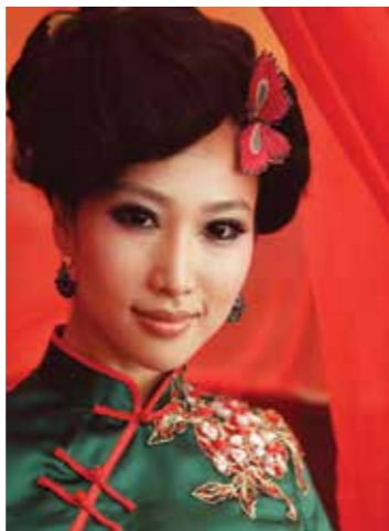
Классическое, известное во всем мире китайское платье носит название чеонгсам

Итак, зададим крайне простой вопрос: кто же живет в Китае? — И получим лаконичный ответ: «народ». Именно так переводится название самой крупной этнической группы «хань», представителей которой мы именуем китайцами.