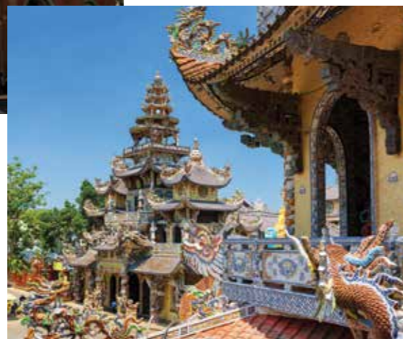
Пагода Линь Фуок (Linh Phuoc Pagoda), Далат

DenBukit The eyes of Paradise Residence & Suite