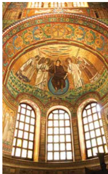
Базилика Сан-Витале (Basilica di San Vitale), Равенна

Был ли Калиостро алхимиком? — Безусловно! Сегодня в замке можно увидеть чистое золото, добытое им лабораторным способом. Был ли он связан с масонами? — Несомненно! Его масонские награды и знаки отличия выставлены в этом же замке. В этих мрачных стенах великий авантюрист и алхимик провел четыре года и умер, по одним