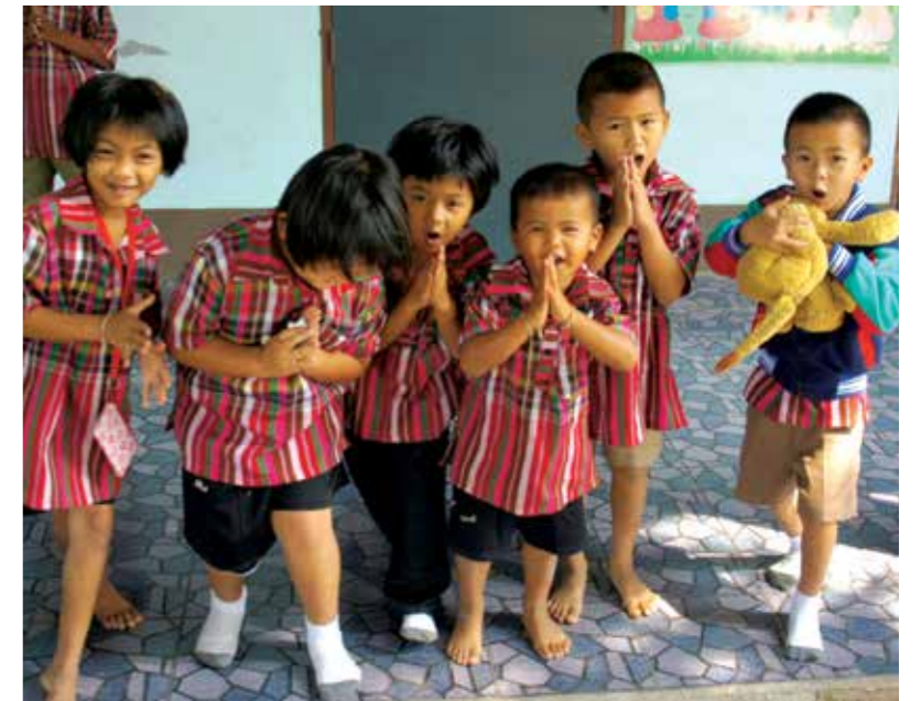
Дети из школы Kalim School, о. Пхукет, Таиланд

** При наличии свободных мест на курорте.