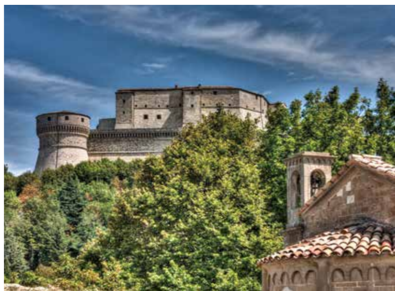
Замок Сан-Лео (San Leo)

свидетельствам, от эпилепсии, по другим — от яда, подсыпанного тюремщиками.