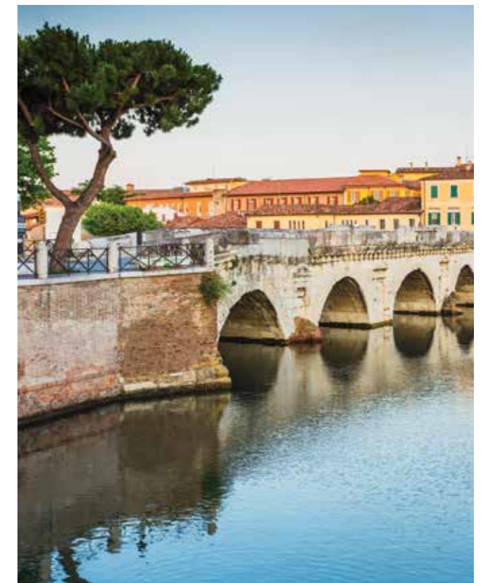
Мост Тиберия (Ponte di Tiberi), Римини

Римини — город, где родился и провел свое детство великий итальянский режиссер Федерико ФЕЛЛИНИ.