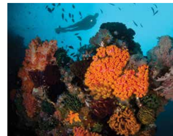
Подводный мир острова удивляет своим разнообразием

На сегодняшний момент на острове Комодо насчитывается около пяти тысяч драконов и они находятся под защитой и наблюдением. Остров Комодо и соседние острова превращены в Национальный парк площадью 1817 кв. километров, включая акваторию островов, имеющую уникальный подводный мир. //