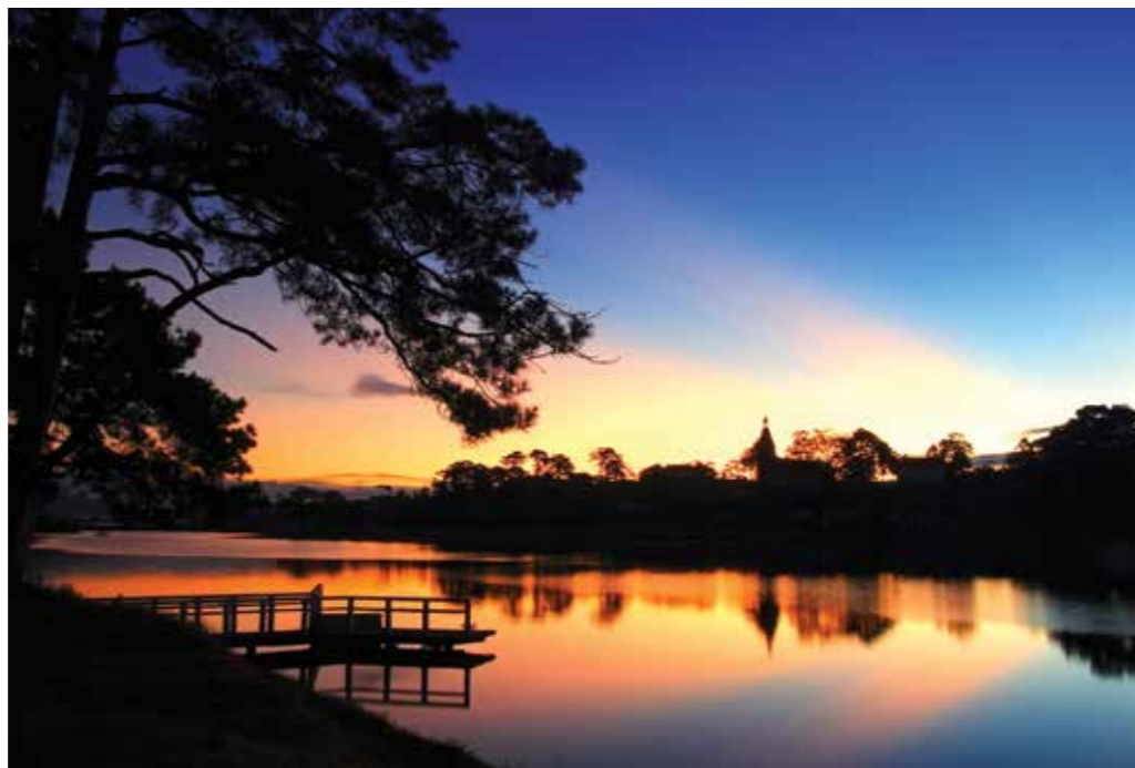
Озеро Суанхьюнг (Xuan Huong)

Если во время пляжного отдыха вам захочется окунуться в легкую и романтическую атмосферу французской провинции — обязательно отправьтесь в Далат — «город вечной весны» и обязательно расскажите своим друзьям, что побывали во Франции, не покидая пределы Вьетнама. //