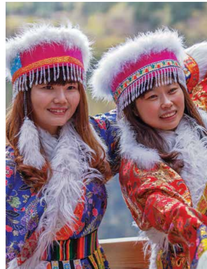
Девушки в национальных костюмах Цзючжайгоу, Центральный Китай