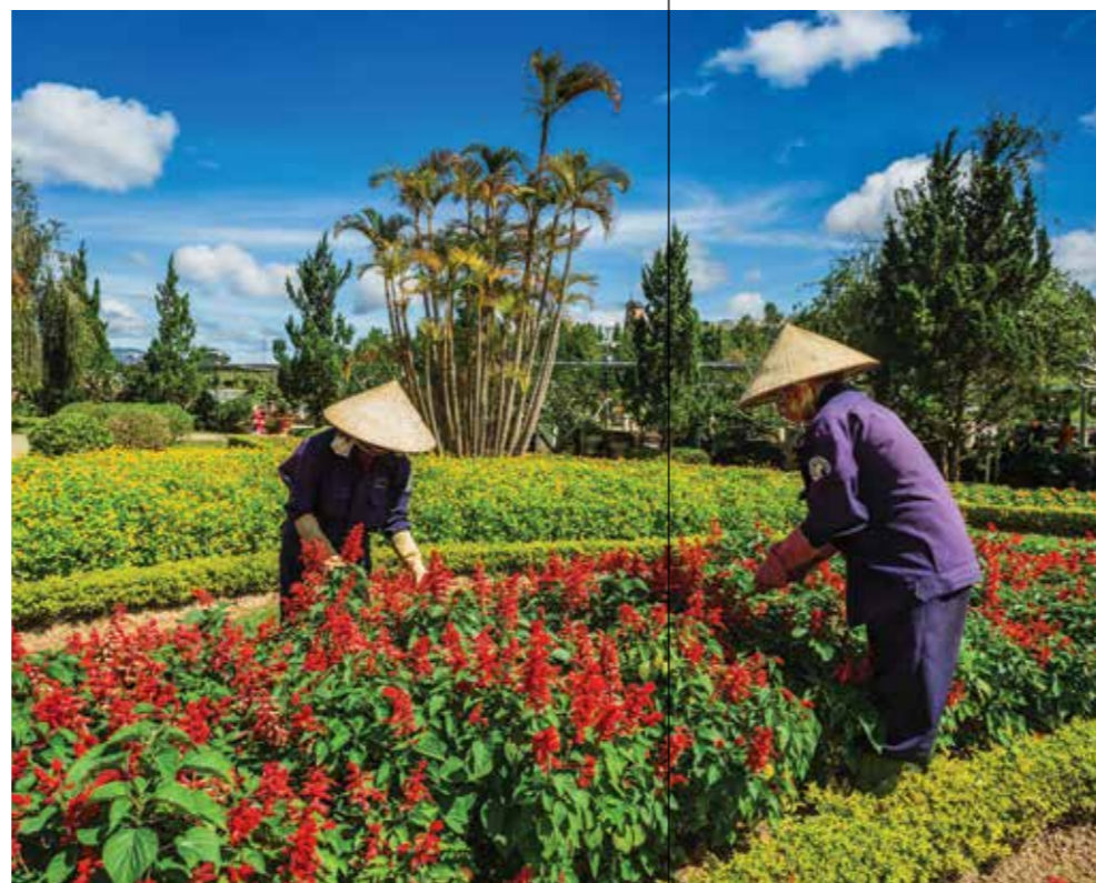
Далат и окрестности