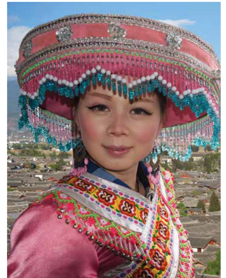
Девушка в национальной одежде округа Лицзян, Южный Китай