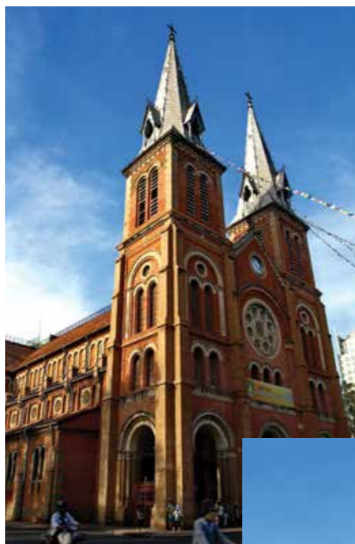
Католический храм в Далате