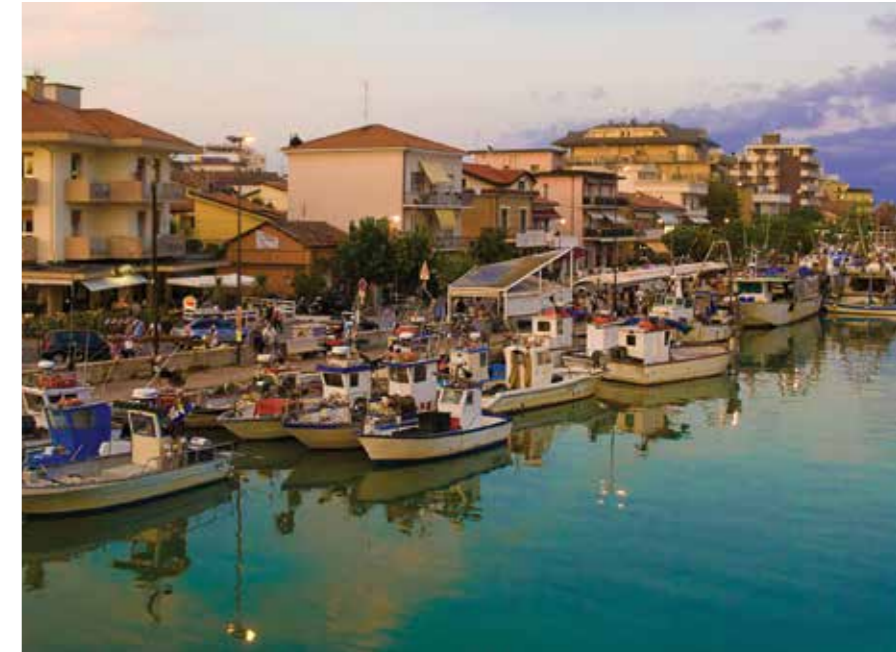
Стоянка рыбацких лодок Марина Беллария Иджеа (Igea Marina Bellaria), Римини

Непередаваемую атмосферу Римини отразил в своих фильмах уроженец города — великий Федерико Феллини. Старый район Римини — Сан-Джулиано (San Giuliano) — место, с которым связаны детские воспоминания гения. На узких улочках до сих пор живут прототипы хулиганского и одновременно поэтичного фильма «Амаркорд», придуманного Федерико Феллини совместно с поэтом и сценаристом Тонино Гуэрра. На местном диалекте «амаркорд» означает «я вспоминаю». Это и есть ключ к пониманию творчества режиссера, поднявшегося на вершину славы, — потребность окунуться в мир своего детства. Стены практически каждого дома расписаны по мотивам фильма, а оттого возникает ощущение, что сюжет разворачивается прямо сейчас. Несмотря на популярность Римини, этому району удалось сохранить атмосферу далеких довоенных лет.