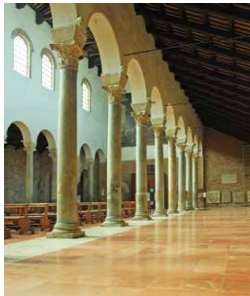
Церковь Сент-Джон Евангелиста (Saint John Evangelista), Равенна