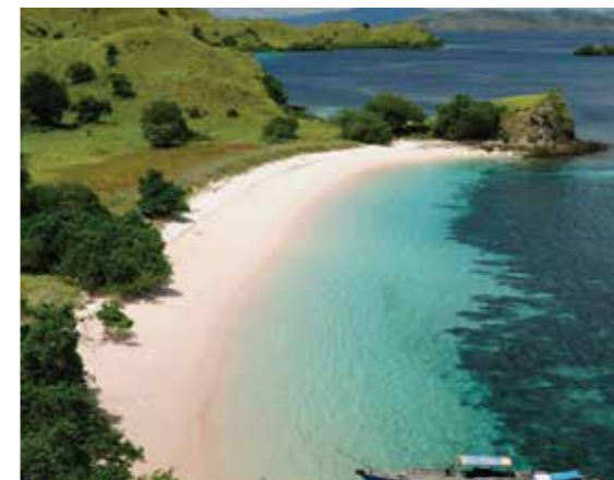
Белоснежные пляжи острова Комодо, Индонезия

Одни предпочитают летом лениво нежиться под ласковым солнцем на пляже, другие любят активный отдых и новые неизведанные места. Сегодня мы отправимся в виртуальное путешествие на остров Комодо, который знаменит своими варанами или драконами — самыми древними существами на планете.