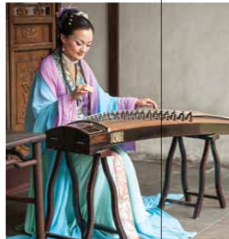
Женщина в национальном костюме Сучжоу, провинция Цзянсу, Китай.

На протяжении многих лет бок о бок с китайцами жили корейцы, непальцы, русские, казахи, монголы, вьетнамцы и многие другие нации. Они привнесли элементы своей культуры, ассимилировались с местным населением, создав неповторимый симбиоз традиций.